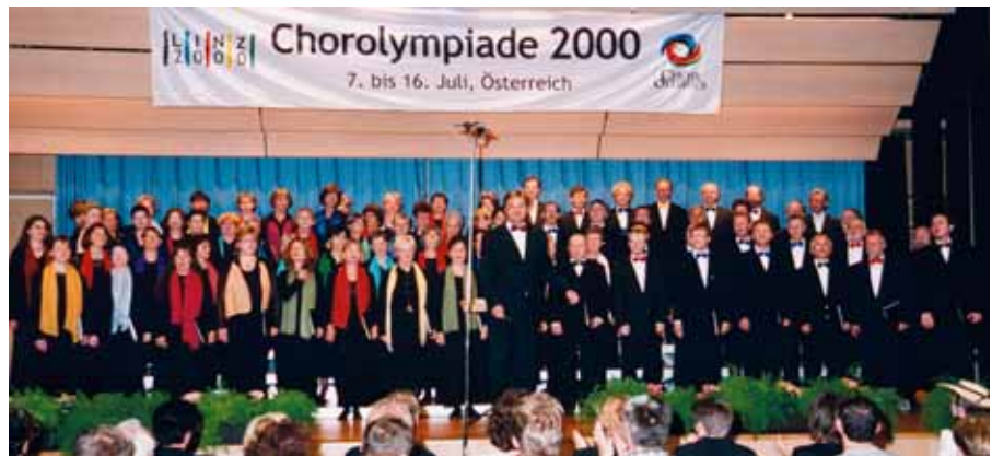
Ausgezeichnet in drei Kategorien mit 2 Silber- und 1 Bronzemedaille